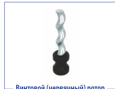
Винтовой (червячный) ротор

*Изготовитель оставляет за собой право на изменение технических характеристик