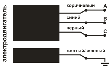
Рис. 4 Принципиальная электрическая схема

Наращивание электрического кабеля должно осуществляться посредством термоусадочной муфты с клеевым внутренним слоем, обеспечивающим герметичность соединения.